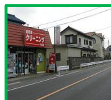
・クリーニング大谷店前