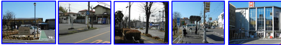
・福寿の里(正面玄関付近) ・西武フラワーヒルバス停付近 ・保健センター(けやき通り側) ・御狩場バス停付近 ・狭山市駅東口(第一プラザパチンコ付近)