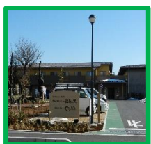
・福寿の里 (正面玄関付近)