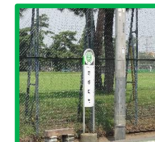
・狭山体育園 (野球場南バス停付近)