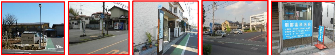
・福寿の里(正面玄関付近) ・西武フラワーヒルバス停付近 ・ネオポリス中央バス停付近 ・ラーク所沢 ・新所沢駅東口(刑部歯科医院付近)