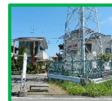
・佐久間工務所西 (本堀バス停付近)