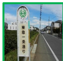
・1条通り (東急一条通りバス停付近)