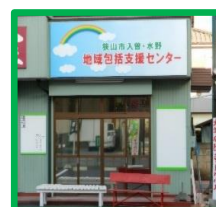
・包括支援センター前 (入曽駅東口より徒歩5分)