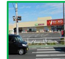
・ヤオコー入曽店前 (狭山入曽郵便局バス停付近)

令和元年7月1日改定 医療法人尚寿会 法人事業本部 時刻表内の赤字は今回改定内容となっております。