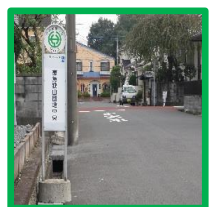
・3条通り (狭山団地中央バス停横)