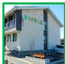
・わが家入曽 (入曽駅西口より徒歩1分)